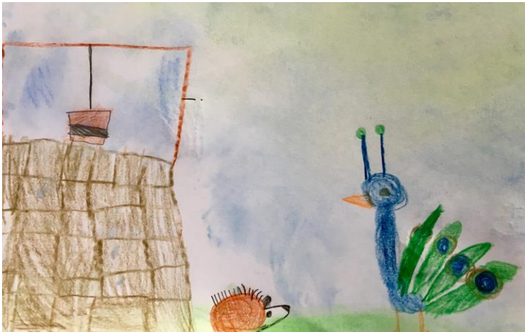
De fabel van de egel en pauw

Ook komen verhalen van verschillende wereldreligies aan bod waardoor de algemene levensopvatting zich ruim en breed kan ontwikkelen: de kinderen leren hierdoor andere culturen kennen.